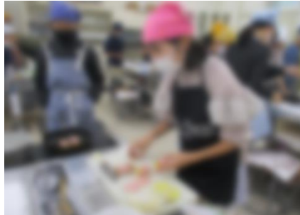
【ベーコン巻きを作っている様子】