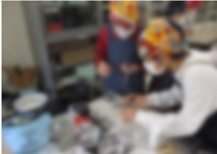
【たまねぎを切っている様子】

栄養のバランスや環境への配慮を考えながら調理計画を立て、実習を行いました。班の仲間と助け合いながら、材料を炒めたり、使った器具を片付けたりする様子が見られました。食材等のご準備、ありがとうございました。