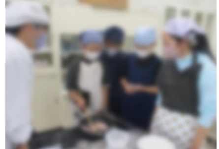
【食材を炒めている様子】