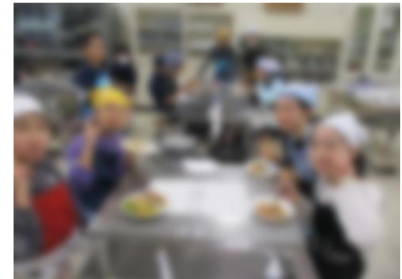
【作った料理を食べている様子】