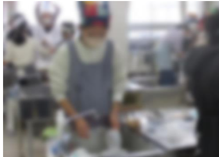
【使った器具を洗っている様子】