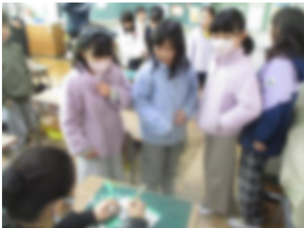
【クラブ活動を見学する様子】