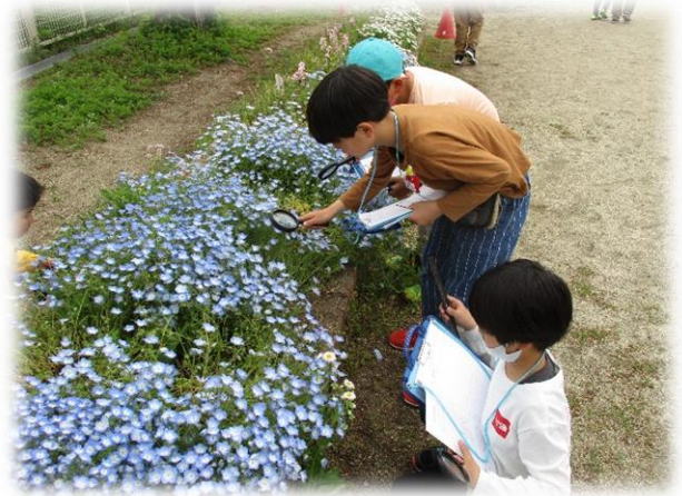
【虫眼鏡をつかって、植物をじっくり観察し、記録している様子】

3年生では、理科の学習が新しく始まりました。最初の学習では、身の回りで見られる様々な動物や植物の色・形・大きさに着目して、自然の観察を行いました。