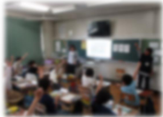
【外国語活動の様子】

3年生になり、2年生までになかった新しい学習が始まっています。子どもたちは興味をもって取り組み、だんだんと慣れ親しんできています。学習の様子については、来月号でお伝えいたします。