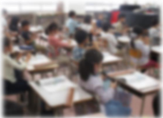
【リコーダーで演奏する様子】