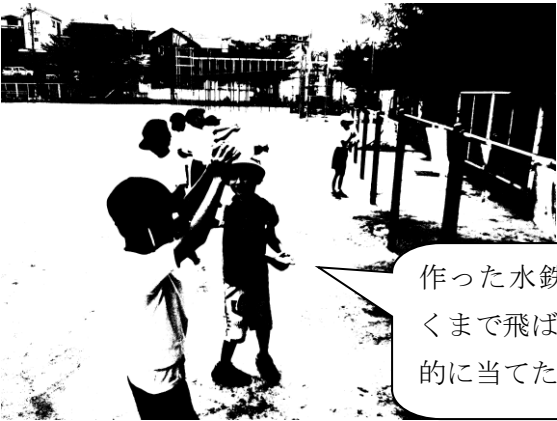
生活科「みずあそび」