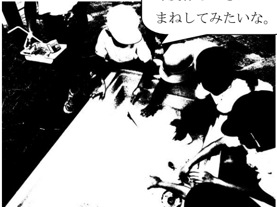
6年生との遊び交流会